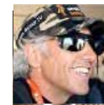
Robin Good Editore indipendente MasterNewMedia